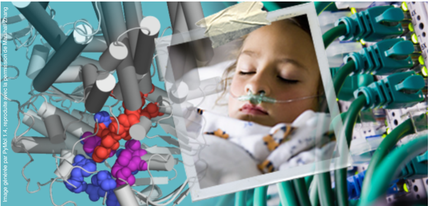
Image générée par PyMol 1.4, reproduite avec la permission de Marshall Zhang

Marshall a utilisé un superordinateur pour trouver de nouveaux médicaments pour lutter contre la fibrose kystique.